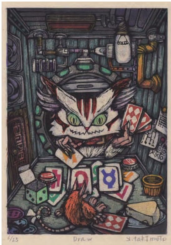
アワガミ国際ミニプリント展2017 大賞「Draw」 瀧本友里子(Yuriko Takimoto)JPN