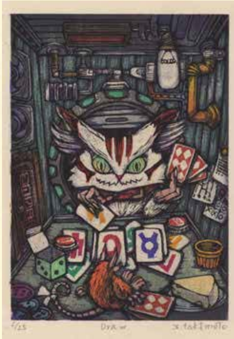
アワガミ国際ミニプリント展2017 大賞「Draw」 瀧本 友里子(Yuriko Takimoto) JPN

The worlds only juried printmaking show exclusively for works on washi